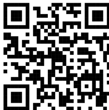
Infographic สรุปการเรียนรู้จากการฝึกปฏิบัติการ เป็นมัคคุเทศก์

ส่วนผลการประเมินความพึงพอใจในการจัดกิจกรรมเตรียมความพร้อมสำหรับการสอบวัดความรู้ความสามารถในการเป็นมัคคุเทศก์ (ออนไลน์) พบว่าผู้เข้าร่วมอบรมส่วนใหญ่มีความพึงพอใจต่อการจัดกิจกรรมโดยภาพรวมในระดับมากที่สุด (ค่าเฉลี่ย 4.85) เมื่อพิจารณาเป็นรายประเด็น 1) ด้านเนื้อหาในการอบรม ผู้เข้าร่วมอบรมส่วนใหญ่มีความพึงพอใจในระดับมากที่สุด ซึ่งเนื้อหาการอบรมออนไลน์ตรงประเด็นและเป็นประโยชน์ ทำให้เข้าใจเนื้อหาเกี่ยวกับแนวทางการสอบมัคคุเทศก์ 2) ด้านวิทยากร/ผู้บรรยาย ผู้เข้าร่วมอบรมส่วนใหญ่มีความพึงพอใจในระดับมากที่สุด ซึ่งวิทยากรสามารถอธิบายเนื้อหาให้เข้าใจง่าย เปิดโอกาสให้ซักถามและแลกเปลี่ยนความคิดเห็น 3) ด้านระบบและการจัดการเรียนการสอนออนไลน์ ผู้เข้าร่วมอบรมส่วนใหญ่มีความพึงพอใจในระดับมากที่สุด โดยระบบออนไลน์มีความเสถียร และเข้าถึงง่าย สื่อประกอบ (สไลด์/คลิป/เอกสาร) มีความชัดเจน และการจัดการเวลาและตารางอบรมมีความเหมาะสม 4) ด้านผลลัพธ์จากการอบรม ผู้เข้าร่วมอบรมส่วนใหญ่มีความพึงพอใจในระดับมากที่สุด ทำให้ผู้เข้าอบรมมีความพร้อมมากขึ้นในการสอบมัคคุเทศก์ และได้พัฒนาทักษะความรู้ทั่วไปสำหรับอาชีพมัคคุเทศก์